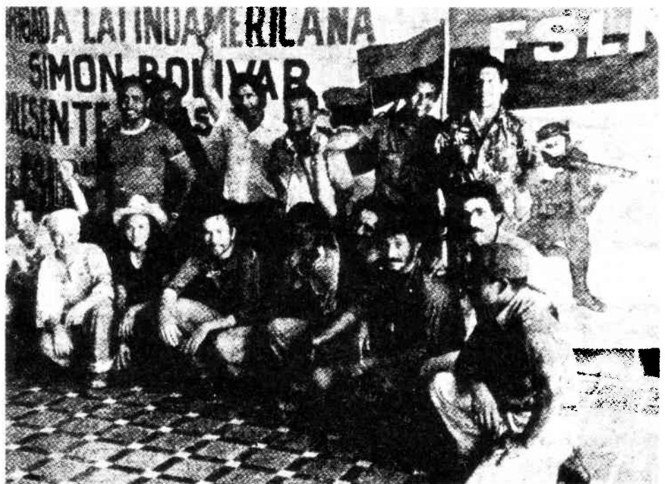
Mitglieder der Simón Bolívar-Brigade

Der große Verlierer in der gegenwärtigen VS-Spaltung wird gewiß Ernest Mandel sein, dessen Augen größer waren als der Mund, und der jetzt vor einem gänzlich leeren Teller sitzt. Extern hat er ein Wirrwarr von opportunistischen Fusionen mit antitrotzkistischen Reformisten der „extremen Linken“ in die Wege zu leiten versucht, mit Organisationen wie der OCI und Pablos AMR in Frankreich bis hin zu Tony Cliffs staatskapitalistischer SWP in Britannien. Währenddessen hat er es den verhärteten Reformisten der amerikanischen Socialist Workers Party (SWP) innerhalb des VS gestattet, sich in ihren Bastionen der zentristischen Opposition von Mandelanhängern zu bemächtigen und ihnen den Garaus zu machen (z. B. die zerstörte Internationalist Tendency in den USA, die absorbierte kanadische RMG). Bis jetzt konnte Mandel genügend Stimmen auf sich vereinigen, um im Brüsseler Hauptquartier des VS den Ton angeben zu können, aber Jack Barnes' SWP hat den ungeheuren Vorteil, über eine kohärente politische Linie zu verfügen. Mit dem Auszug der LTT/BF und den diversen Linken, die sie mit sich schleppt, wird sich das VS vermutlich um eine refor-