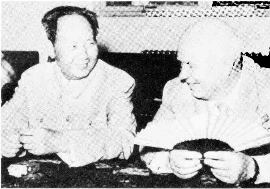
Mao und Chruschtschow in bestem Einvernehmen – 1958, zwei Jahre nach dem Zwanzigsten Parteitag der KPdSU