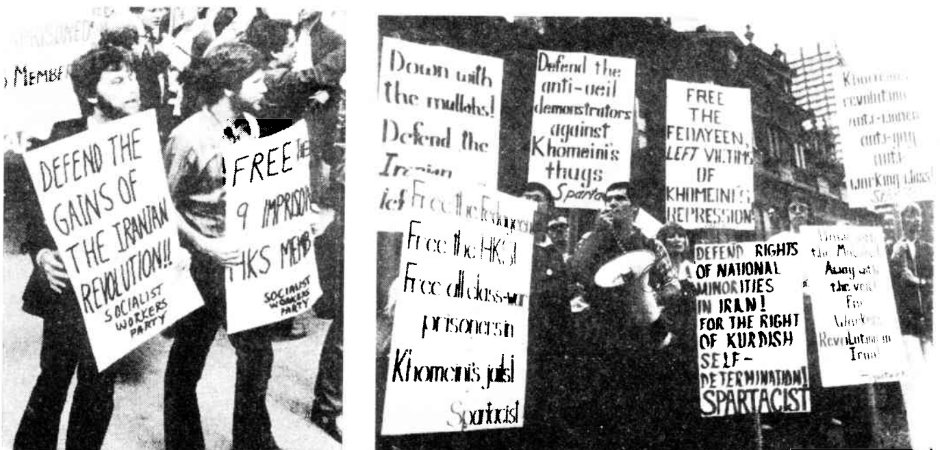
Die SWP verteidigt Chomeini. Die iST verteidigt die iranische Linke.