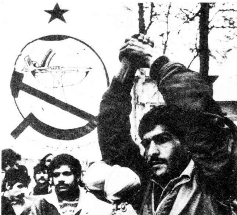
Fedajin-Sprecher an der Teheraner Universität forderte Beteiligung an Bazargan-Regierung

Gegen die methodologischen Argumente der für Chomeini eintretenden linken Gruppen zu polemisieren, ist insofern nicht allzu leicht, als sie überhaupt keine vorzuweisen haben. Daß Chomeini die Massen auf die Straße führt, wird als Anfang und Ende aller Argumente vorgebracht. In einer Konfrontation mit Mitgliedern der Spartacist League auf einem Forum am 4. März in New York rief der Führer der Socialist Workers Party (SWP), Barry Sheppard: „Revolutionäre waren mit Chomeini und dieser Revolution, waren mit den Massen auf der Straße gegen die Monarchie. Nur Konterrevolutionäre würden