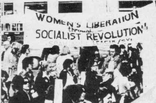
Demonstrationsblöcke der iST in Deutschland, den USA und Australien: Für eine kommunistische Frauenbewegung!