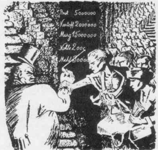
„Kritik des gesamten Proletariats bringt das Ende der Wucherherrschaft“