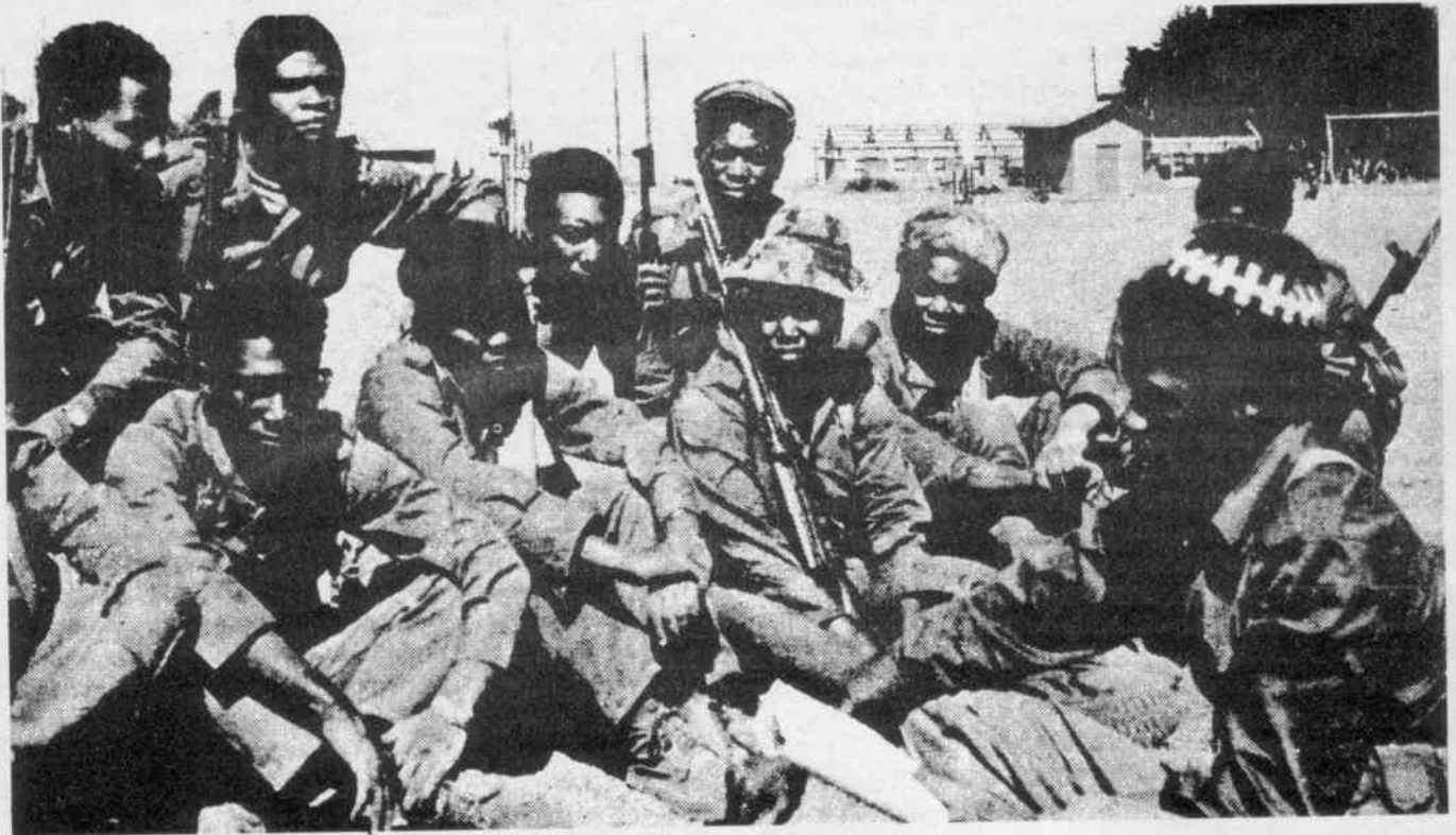
Guerillakämpfer in Simbabwe

1965 eine einseitige Unabhängigkeitserklärung (Unilateral Declaration of Independence – UDI) abgaben, London erklärte darüberhinaus „jede Gewaltanwendung für ungesetzlich“ und entschied sich für wenig effektive Sanktionen. Wiederholte Appelle an England brachten nichts als Enttäuschung.