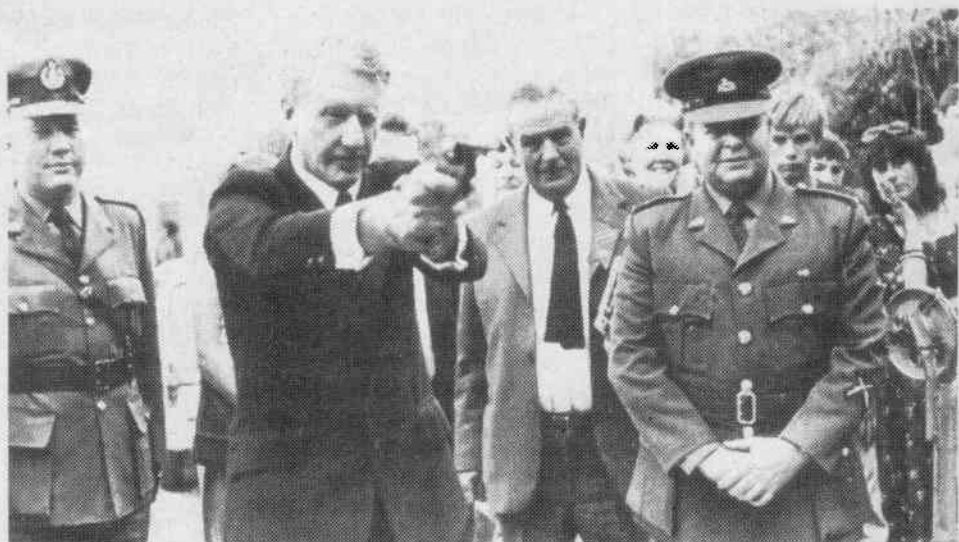
Ian Smith: Repräsentant der weißen „Herrenrasse“.

1960 zu den Gemäßigtesten und Erfolglosesten auf dem Kontinent. Die neokolonialen schwarzen Führer bilden keine geschlossene Front, sie sind untereinander heftig zerstritten. So waren auf den Genfer Verhandlungen zusätzlich zu Mugabes ZANU-Delegation, der sich Führer der Volksarmee von Simbabwe (ZIPA), die ihren Stützpunkt in Moçambique hat, anschlossen, auch die Delegierten der Afrikanischen Volksunion (ZAPU) anwesend, die von dem immer so vernünftigen Joshua Nkomo angeführt wurde, dem schlauesten und dauerhaftesten der nationalistischen Politiker und demjenigen (neben Muzorewa) mit der stärksten Unterstützung vom Westen. Die beiden anderen Delegationen waren ein lebendiger Beweis für den gemeinen politischen Verrat und personalistische Fraktionskämpfe in der Unabhängigkeitsbewegung über eine Zeitspanne von mehr als zehn Jahren.