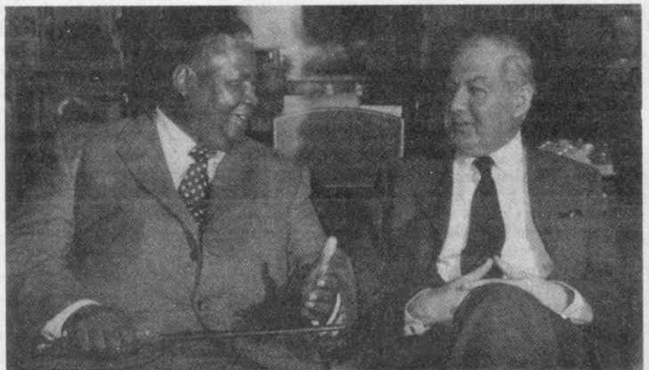
Callaghan und Nkomo: Freunde unter sich.