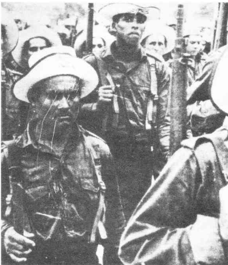
Links: Kubanische Arbeitermiliz während der frühen 60er Jahre. Seite 6: Hauptquartier von Radio Rebelde in der Sierra Maestra.

Inzwischen war die Polarisierung innerhalb der heteroge-