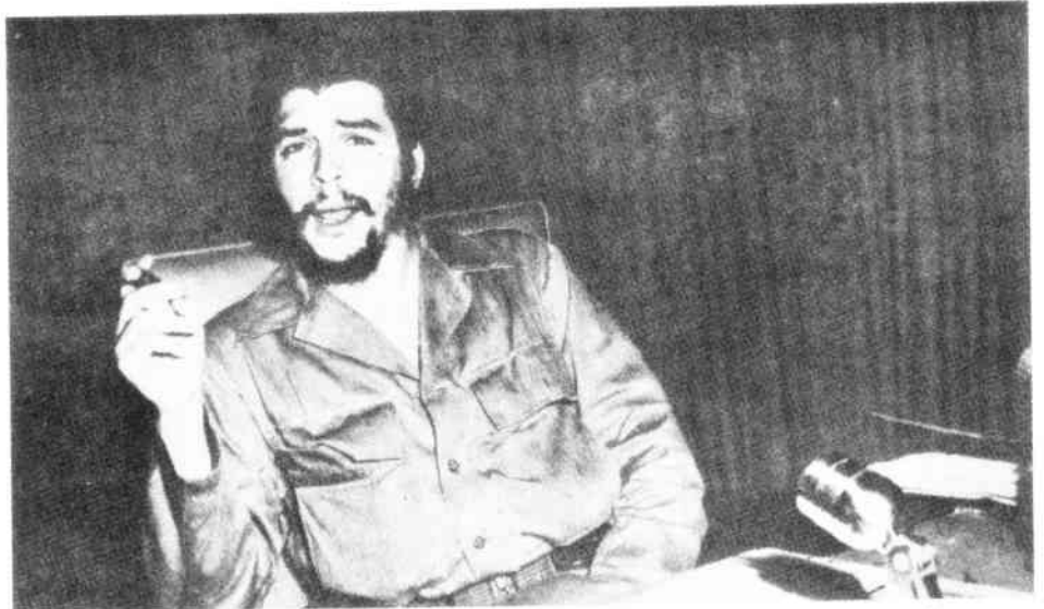
Che Guevara auf einer Pressekonferenz in Havanna, Oktober 1960.