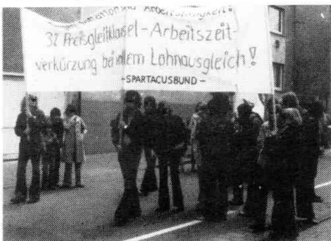
„Aufgesplitterte“ Übergangsforderungen des Spartacusbundes: Vertrauensleutekontrolle und 3% Preisleitklausel.