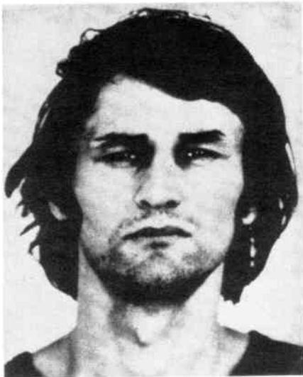
Holger Meins, Opfer der bürgerlichen Klassenjustiz.

lands hat nie ihre Differenzen zu der strategischen Konzeption der R.A.F. verschwiegen. Wir haben betont, daß das Proletariat nicht durch kämpferische Gewaltaktionen mobilisiert werden kann, um die proletarische Revolution vorzubereiten. Diese historische Aufgabe kann nur durch das Hineintragen der revolutionären Propaganda in die Arbeiterklasse, durch den Aufbau einer revolutionären Partei, basierend auf den Lehren von Marx und Engels, Lenin und Trotzki, realisiert werden. Eine solche revolutionäre Kritik an der Politik der R.A.F. ist für uns jedoch kein Grund, bei Angriffen des bürgerlichen Staatsapparates auf diese Organisationen eine „neutrale“ Haltung einzunehmen. Ein Angriff gegen eine Organisation der Linken und Arbeiterbewegung richtet sich gegen alle. Die TLD hat sich deshalb dafür eingesetzt, eine gemeinsame Demonstration aller linken Gruppen und Organisationen durchzuführen, die den Anspruch erheben,