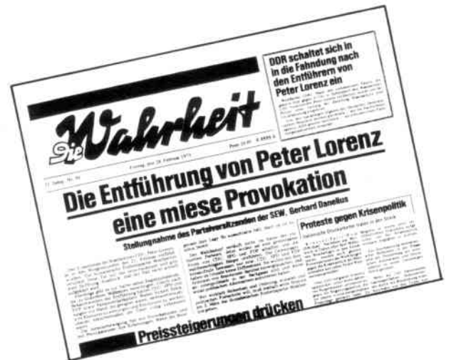
Die SEW distanziert sich von der Lorenz-Entführung und meldet DDR-Fahndung nach Anarchisten.

Auch die Kommunistische Partei Deutschlands (Horlemann) wehrt sich dagegen, mit der Lorenz-Entführung in Zusammenhang gebracht zu werden ( Rote Fahne , 5. März 1975). Ihr Berliner Regionalkomitee hatte sogar anfänglich von sich hören lassen, daß aufgrund der Lorenz-Entführung eine zügellose Hetze gegen die KPD geführt worden sei, und somit zu verstehen gegeben, daß die KPD aufgrund der Entführung ihr selbstgestecktes Ziel nicht erreicht habe; wir be-