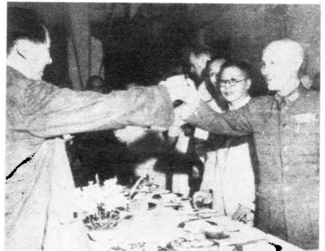
Maos „antiimperialistische Einheitsfront“ mit Tachiang Kai-shek (1945).

Welche Verbrechen hatten diese chinesischen Genossen begangen, um bei Pablo und Mandel auf taube Ohren zu stoßen? Mandel tadelte einige politische Fehler der chinesischen Sektion aus dem Jahre 1947, aber es war kein politischer Fehler, der Mandel/Maitan/Frank gegen die chinesischen Trotzkisten aufbrachte. Für die Pabloisten war die chinesische Revolution das positivste Beispiel der „neuen Weltrealität“, welche nichtproletarischen Kräften revolutionäre Fähigkeiten zuschrieb. Infolgedessen war die chinesische trotzkistische Partei, die weiterhin gegen Mao opponierte, für die