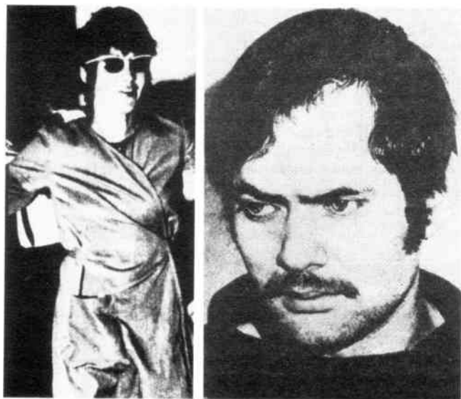
Meinhof und Baader: prominente R.A.F.-Genossen.

Wir alle wissen, daß der Polizeiterror der letzten Tage in Westberlin nicht durch die Aktion der Bewegung 2. Juni hervorgerufen wurde. Urheber war vielmehr der bürgerliche Staat, zu dem nackte Brutalität dazu gehört und der ohne sie, der ohne „die besondere Formation bewaffneter Menschen“, wie Engels es ausdrückte, gar nicht existieren kann. Die Genossen der Bewegung 2. Juni müssen vor den drohenden Angriffen des bürgerlichen Staatsapparates verteidigt