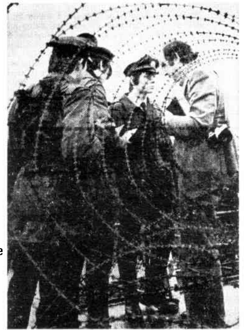
Schwer bewaffnete Polizei „sichert“ Klassenjustizprozeß.

zei – und das heißt in erster Linie: wir kämpfen gegen die gewerkschaftliche Organisierung der Polizei. Die Polizei als bürgerliche Formation hat in den Massenorganisationen des Proletariats nichts zu suchen. Polizei raus aus dem DGB! Die materielle Existenzsicherung und -verbesserung für Polizeiangehörige im ökonomischen Tageskampf der Gewerkschaft dient in letzter Analyse der Herrschaftssicherung des Kapitals! Damit leugnen wir nicht die politische Arbeit zur Zersetzung der Polizei, die Ausnutzung von Widersprüchen, die zwischen Repräsentanten des „starken Staates“ und „demokratischen Kräften“ auftauchen mögen, für die revolutionäre Entlarvung des bürgerlichen Staates usw. Wir leugnen aber, daß sich in der Unterdrückungsinstitution Polizei das Verhältnis von ge-