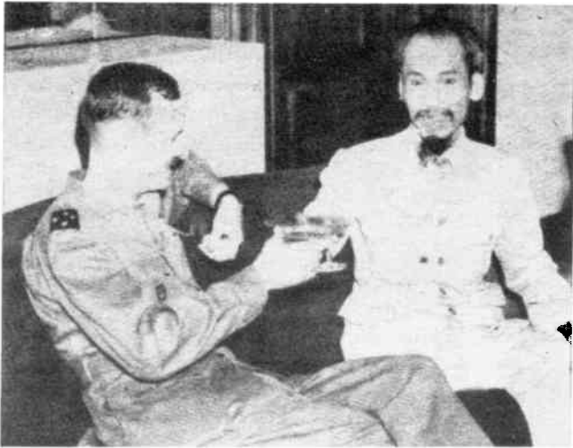
Ho Chi Minh begrüßt 1946 General Leclerc, den Repräsentanten der französischen Truppen, die kurz danach die Viet-Minh-Regierung stürzten

groß wenn nicht größer – so wiegt dieses Ereignis auf der Waage des zwanzigsten Jahrhunderts viel geringer als der Sieg der chinesischen Revolution.“ (Dokument der IEK-Mehrheits-Tendenz: „The Differences in Interpretation of the ‚Cultural Revolution‘ at the Last World Congress and Their Theoretical Implications“, International Information Bulletin der SWP, November 1973)