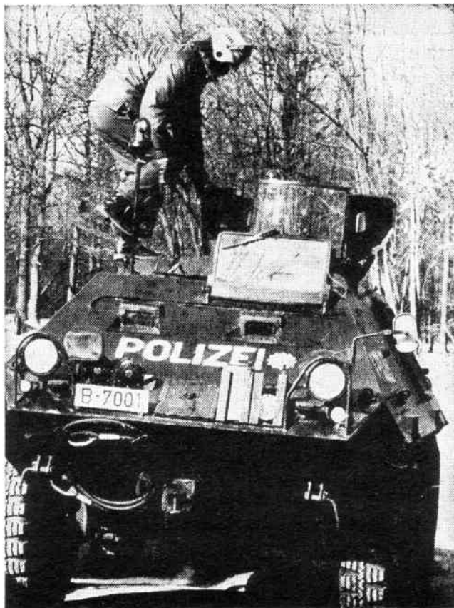
Panzereinsatz bei der Suche nach den Lorenz-Entführern.

Entspringt die Unterdrückungsfunktion der Polizei dem Klassencharakter des Staates, so ist klar: zwischen der Arbeiterbewegung und dem Polizeiapparat zieht sich der antagonistische Graben, der diese Gesellschaft spaltet; er wird überbrückt allein im bewaffneten Kampf. Propagandistische Aufklärung muß auf die ideologische Subversion der Staatsfunktionen, auf die Zersetzung der Staatsstrukturen zielen. Die revolutionäre Zersetzung der bewaffneten Formationen des bürgerlichen Staates – gleichbedeutend mit der Zerschlagung des bürgerlichen Staates – erfolgt in der Konfrontation mit den bewaffneten Massen des Proletariats. Wir polemisieren damit nicht bloß gegen den idyllischen APO-Slogan „Macht aus Polizisten gute Sozialisten“, nicht bloß gegen Vorstellungen, die die Polizei zu demokratisieren, sondern wir bekämpfen jede Form von Solidarität der Arbeiterbewegung für die Poli-